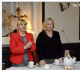
fol. W. Marzec