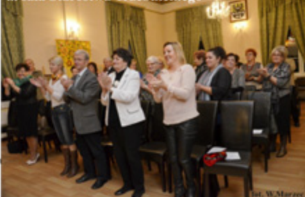
fol. W. Marzec